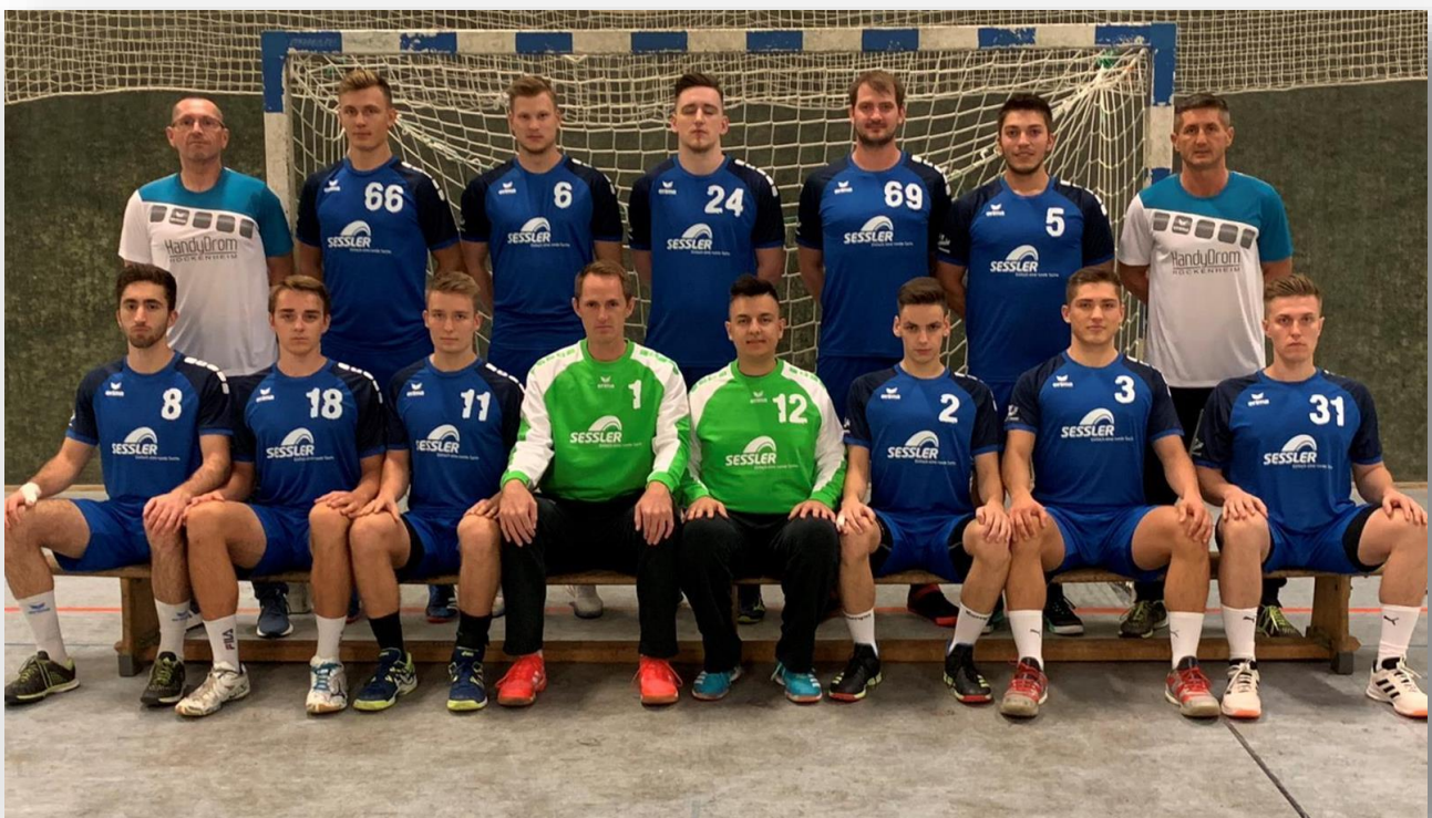
Mannschaftsbild - 1. Herrenmannschaft [Stand: September 2019]

Die zweite Herrenmannschaft spielt in der Kreisliga II und will sich perspektivisch in Richtung Landesliga orientieren. Dabei steht die behutsame Einbindung talentierter Jugendspieler an ein gutes Seniorenniveau im Vordergrund, so dass die Nachwuchsspieler von Beginn an beste Möglichkeiten haben, um in die erste Mannschaft integriert zu werden.